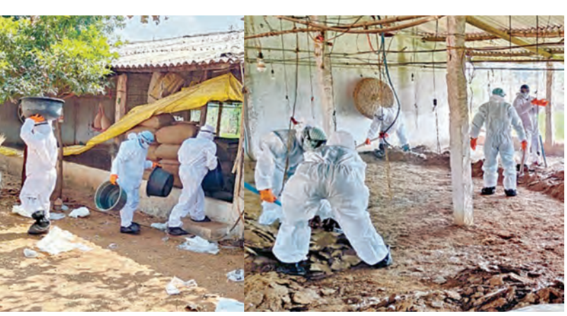
కోళ్ల ఫారంలో శానిటేషన్, దాశా బస్సులు, కోళ్ల పేదను పూర్తిగా గోతుల్లో పూడ్చివేస్తున్న సిబ్బంది