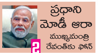
ప్రధాని మోడీ ఆరా ముఖ్యమంత్రి రేవంత్ కు ఫోన్

మహబూబ్ నగర్ జిల్లాలో, నాగర్ కర్నూల్ ప్రతినిధి, ఫిబ్రవరి 22, ప్రభాతవార్త: క్రీడలం ఎడమగట్టు కాలువ (ఎన్ఎల్ఐసి) సౌరంగం పనుల్లో అవకాశం చోటు చేసుకున్నది. బోరింగ్ పని మొదలుపెట్టిన వెంటనే టన్నెల్ సైట్ గంలో ఒక్కసారిగా కుప్పకూలింది. నాగర్ కర్నూల్ జిల్లా పరిధిలోని >>2